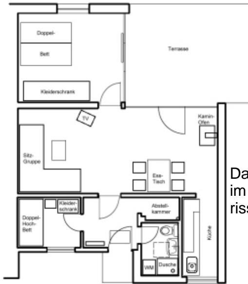
Das Haus im Grundriss